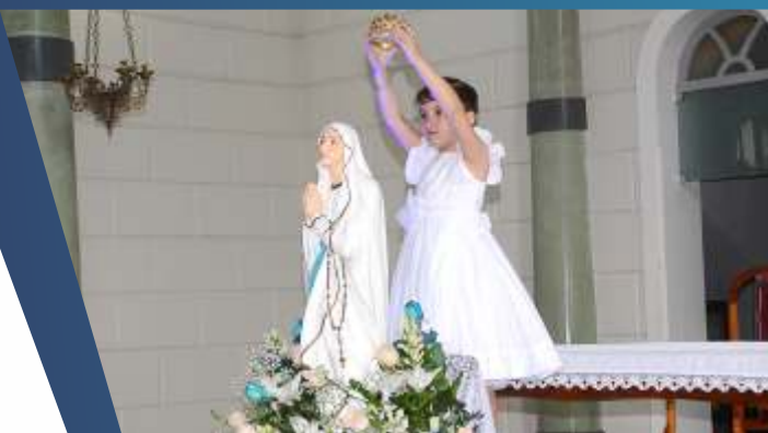
COLÉGIO NOSSA SENHORA DAS GRAÇAS