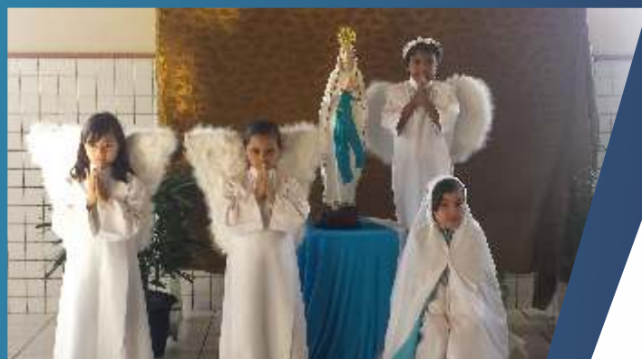
ESCOLA SANTA INÊS