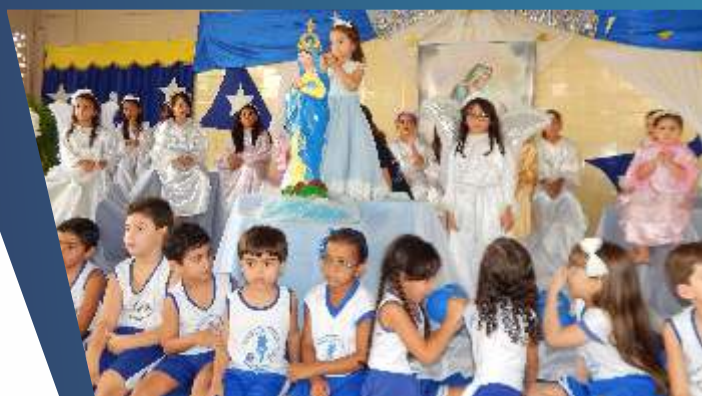
COLÉGIO NOSSA SENHORA DA CONCEIÇÃO