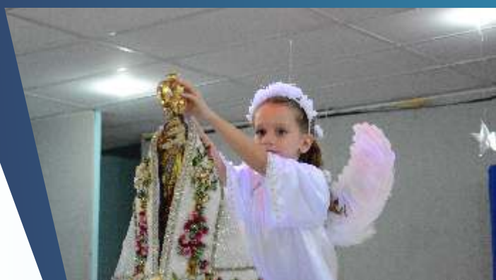
COLÉGIO SANTA CATARINA DE SENA