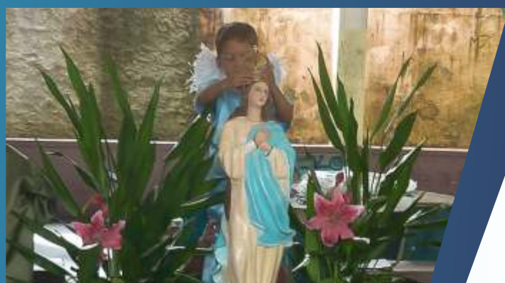
COLÉGIO NOSSA SENHORA DO Ó