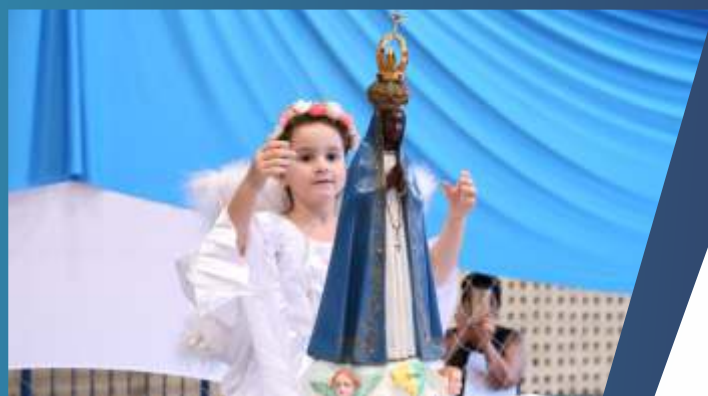
COLÉGIO SAGRADO CORAÇÃO DE JESUS